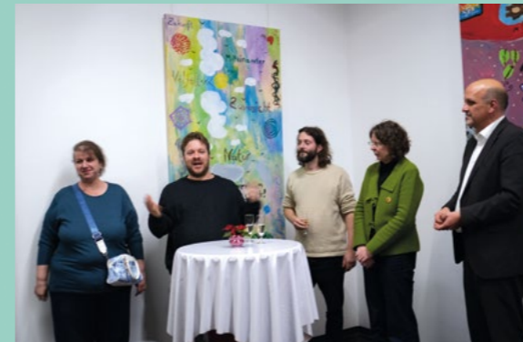
Ausstellungseröffnung von „Meine Heimat Rollberge“ im Rathaus Reinickendorf vom 17.11.2025

Was: Eröffnung der Ausstellung „Meine Heimat Rollberge“ vom Kunstnetzwerk Titiseestraße - mit Snacks und Getränken. Die Ausstellung ist bis 12. Mai zu sehen. Wo: Streethouse, Schluchseestraße 46