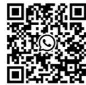
Kiez-Box Rollberge Whats-App-Gruppe