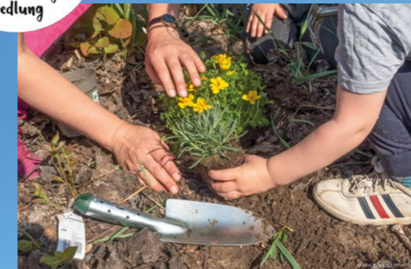
Wir pflanzen Blumen für die Rollbergesiedlung