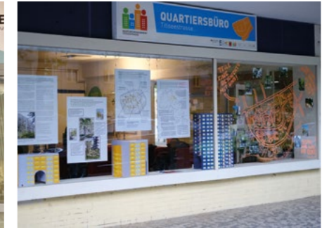
Hier findet ihr das Alfabündnis. Im QM-Büro. Neben der Apotheke. Auf der Titiseestraße 5.

von Teresa Rodenfels, Kordinatorin Alfabündnis Reinickendorf