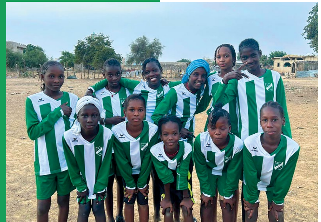
Team Mauretanien

Weitere Fotos findet Ihr auch hier: https://1fc-luebars.de/2026/01/14/trikotspende/