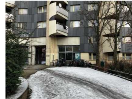
Hier findet ihr den Kurs zum Lesen und Schreiben lernen. Im Stadtteilzentrum. Das ist im großen Hochhaus unten drin. Zabel-Krüger-Damm 52.