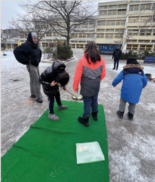
Kreativ zu jeder Jahreszeit: Kinder beim „Eisstockschießen“ auf vereistem Poppele-Platz im Januar