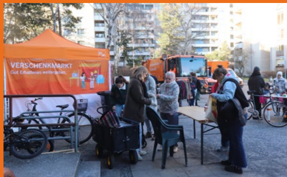
Sperrmülltag und Verschenkmärkt im Rollbergkiez

- Die BSR hat tolle Tipps zum Vermeiden von Müll und, wie Müll richtig entsorgt wird: https://www.bsr.de/