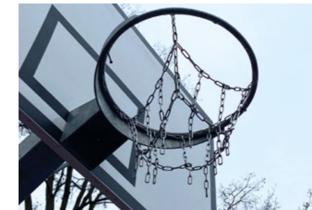
Beschädigtes Korbnetz