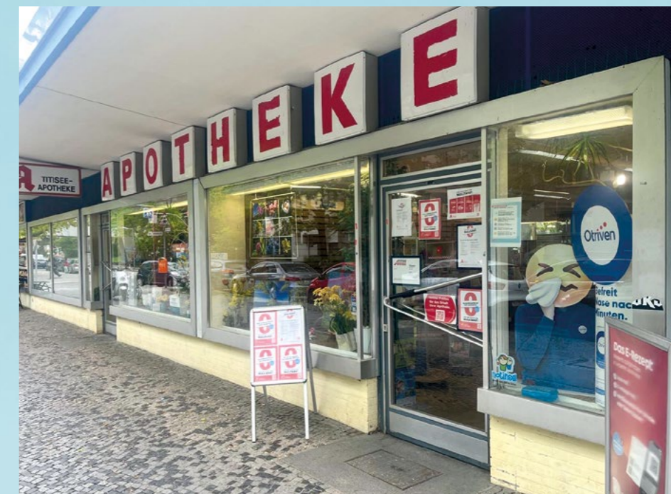
Titisee-Apotheke – Familienbetrieb und Institution in der Rollbergesiedlung