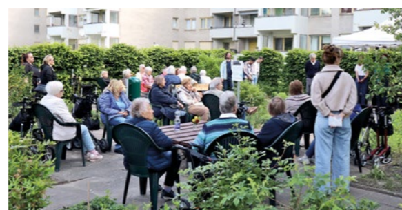
Fest im Rosengarten zum Tag der Städtebauförderung