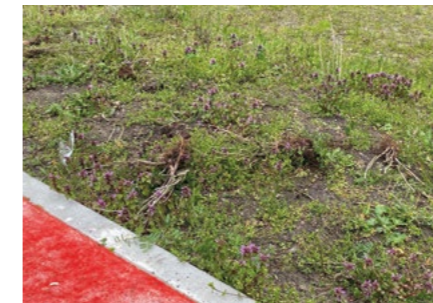
Herausgerissene Pflanzen

Damit unser Bolzplatz ein Ort bleibt, an dem man sich gerne aufhält, bitten wir alle Nachbar*innen um Aufmerksamkeit: Hinhören, hinschauen, notfalls bei der Gewobag melden – und vor allem mit den Menschen vor Ort ins Gespräch kommen. Gemeinsam können wir dafür sorgen, dass unser Sportplatz gepflegt bleibt und sich jede und jeder hier wohlfühlt.