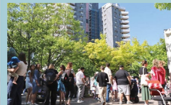
Buntes Treiben auf dem Kiezfest der Rollbergesiedlung