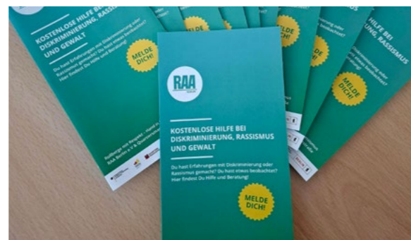
Die Flyer sind da!