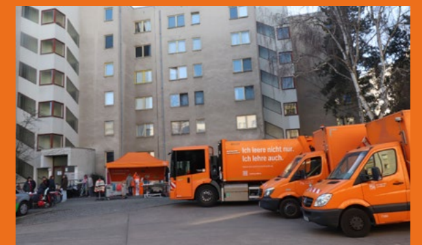
Sperrmülltag und Verschenkmärkte im Rollbergkiez