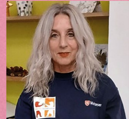
Sigrid Chongo